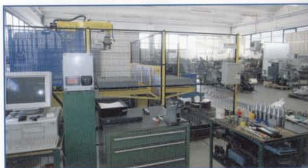
Veduta d'insieme dell'azienda Officine Valbusa di Porto Mantovano

Le stazioni remote sono dotate di PLC FPX, pannello Panasonic touch screen GT01 e transponder per la lettura delle card Rfid. La stazione centrale è composta dal PLC FP2SH e dal Web server Panasonic, collegato alla rete intranet dei PC aziendali. Con il piccolo FP Web server sono state