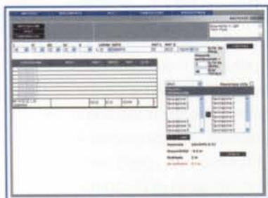
Software specifico per il rilevamento e la gestione dei dati, basato su un database MySQL

realizzate molte applicazioni di telecontrollo sia locale che remoto, via Internet e rete Gprs. Fra le caratteristiche vincenti del prodotto figurano la semplicità di gestione delle pagine html collegate ai dati presenti nel PLC, complete di grafica e librerie Java e la possibilità di inviare e-mail su evento con allegati i dati del PLC. FP Web server supporta anche il protocollo Modbus TCP-IP, sia server che client. Per realizzare il controllo produttivo, Marte Comunicazione & Sistemi Informatici ha creato un software specifico per il rilevamento e la gestione dei dati, basato su un database MySQL. Tramite un'interfaccia grafica dedicata, l'operatore genera un ordine di produzione assegnando a ciascun pezzo le fasi di lavorazione adeguate, richiamandole da un archivio pre-caricato. I dati vengono salvati in una card Rfid, che garantisce il riconoscimento del pezzo all'interno della catena produttiva. I dati memorizzati nella card vengono poi trasferiti alla sta-